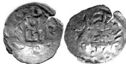
0.59 Поверх аспра типу 2С

розподіл емісії аспрів Давлата Берди по періодах його правління не складе труднощів. Варто пам'ятати, що ми не займались спеціальним дослідженням штемпельних зв'язків цих монет і ці висновки на даний час є попередніми. У випадку, якщо б зустрілись перекарбування літерою «g» аспрів Давлата Берди, визначення типу перекарбованого аспра дозволило б зробити точніші висновки. Але таких монет нам на сьогоднішній день не відомо – очевидно, генуезці не потребували підтвердження надкарбуванням своїх гарантій на своїх же аспрах.