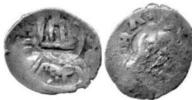
0.74 Поверх аспра типу 2С

Відомі надкарбування аспрів Давлата Берди «Колюмнами» без крапок. Ймовірно, це найперші випадки їх перекарбування і вони відбувались у 1423 році. В даному випадку ми приймаємо за аксіому, що штемпелі «Колюмн» із крапками почали застосовуватись дещо пізніше аніж штемпелі Колюмн без крапок. Це твердження не ставилось під сумнів ніким із попередніх дослідників, і, в цілому, підтверджується спостереженнями. Проте слід зазначити, що застосування штемпелів «Колюмн» із крапкою і без крапок може відображати не часовий, а, наприклад, географічний фактор.