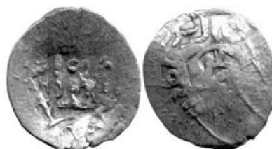
0.71 Поверх аспра типу 2В