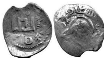
Поверх аспра типу 2А