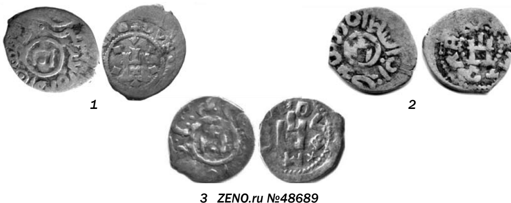
3 ZENO.ru №48689