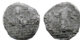
Рис. 4. Булла № 221a-3

левой. Слева колончатая надпись: О – А – Г – W, справа: (Г – Е) – О(РЬ) – Г. Вокруг точечный ободок. Диаметр 21 мм. Место находки: Новгород, Городище, 1998 г. Хранится в Новгородском музее, № 40519 (рис. 2) [5, № 221a, рис. 19].