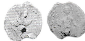
Рис. 5. Булла № 221a-4

Булла № 221a-5. Тех же пар матриц. Диаметр 16 мм. Место находки: Брянская обл., 2009 г.