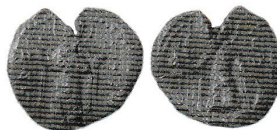
Рис. 3. Булла № 221a-2