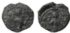
Рис. 7. Булла № 2216

Буллы № 2216. Лицевая сторона. Ростовое изображение св. Софии с распротёртыми вверх руками. Слева колончатая надпись: N – A, справа: C – W (вошла частично). Вокруг точечный ободок. Обратная сторона. Ростовое изображение св. Георгия с копьём в правой руке и со щитом в левой. Слева колончатая надпись: O – GE (вошла частично), справа: G. Вокруг точечный ободок. Диаметр 16–18 мм. Вес – 3,58 г. Место находки: Минская обл., Минский район, 2015 г. Хранится в частной коллекции. Публикуется впервые (рис. 7). Эта печать была найдена вместе с буллой № 221а-3. Зарегистрирован 1 экз. печати этой пары матриц. Таким образом, в настоящее время известно 8 экз. булл княгини Софии, от трёх пар матриц. Топография находок: Минская обл. – 3 экз., Брянская обл. – 1 экз., Новгород – 2 экз., Беларусь – 1 экз., Латвия – 1 экз.